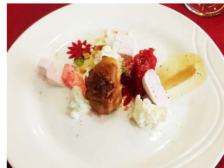
Soe õunakook, peediõied, maasika vahu- komm, vaarika svamm, vaarika plaadikomm, musta pipra karamell, mandlid ja vanilje lumi