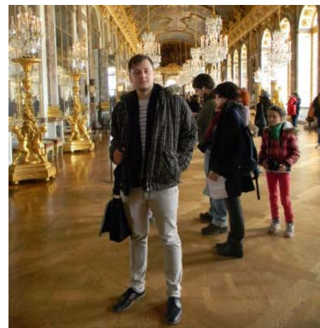
Mina Versaille'i lossi Peeglisaalis

Mõlgutan mõtteid tulevadel kohalikel omavalitsuste valimistel kandideerida valla volikokku, kuna leian, et tegemist oleks suurepärase