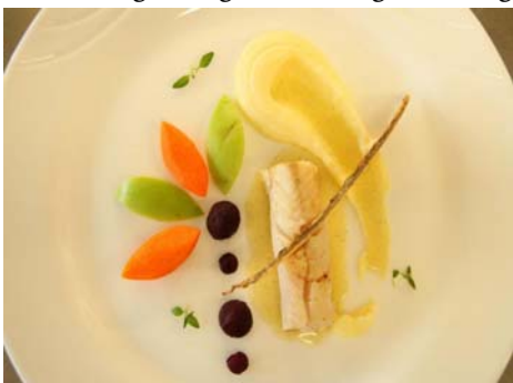
Madaltemperatuuril küpsetatud haugirull täidetud haugi moussega koos kartulivahu ja Beurre Blanc kastmega, serveeritud koos köögiviljade ja õunaga, haugi naha chips