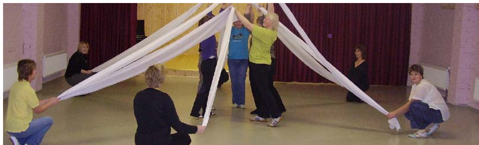
Peetri naisrahvatantsurühm harjutab suviseks võimlemispeoks kava pikkade sallidega.