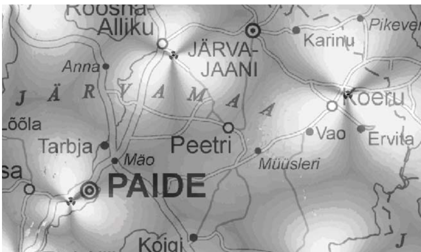
○ väga hea levi ● hea levi ● keskmine levi

KÕU interneti kasutamiseks pakub Eesti Energia nii mobiilseid seadeid, mis võimaldavad kasutada interneti teenust asukohast sõltumata kui ka WiFi võimekusega koduseadmeid, mis sobivad eelkõige paiksele kliendile, kelle kodu või kontor asub maapiirkonnas. Mitte vähe tähtis on ka KÕU seadmete kasutamise lihtsus. Seade tuleb ühendada arvutiga ja arvuti ongi internetis töötamiseks valmis.