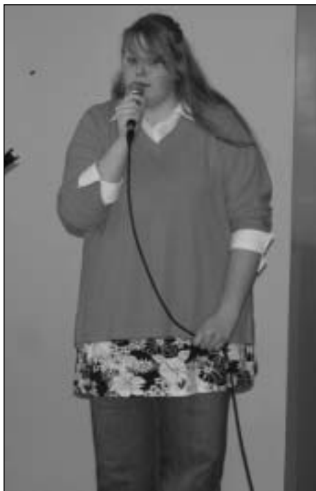
Ele Vaga laulis Peetris, Koerus ja Paides hästi.